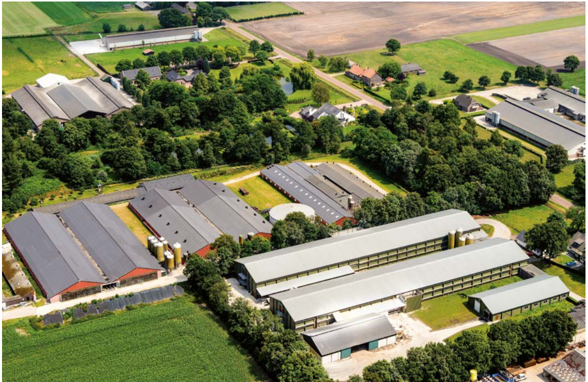
IJsselsteyn, Limburg, gemeente Venray, zeer grootschalige veehouderij bedrijven in de Peel.