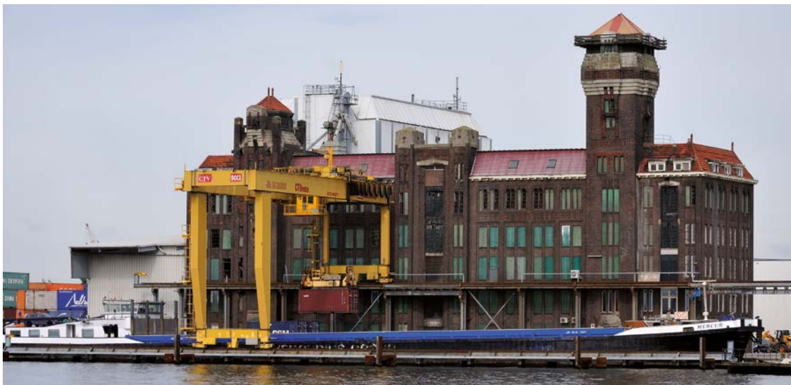
Zaandam, stoommeelfabriek Vrede (1917), Noordzeekanaal

De gebiedsbiografie kan op meerdere manieren bijdragen aan een proces van gebiedsontwikkeling. Het kan bijdragen aan visievorming, participatie, keuzes maken en verschillende oplossingsrichtingen schetsen.