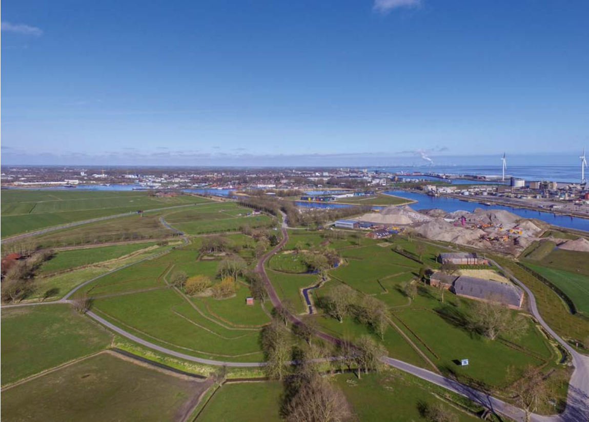
Weierd met wierde (rond jaartelling), achtergrond industrie Delfzijl, Farmsum en Dollard

Er zijn al diverse gebiedsbiografieën en landschapsbiografieën gemaakt die een goed instrument blijken te zijn om het gesprek te voeren over de omgevingskwaliteit van het gebied en de toekomstige ontwikkelingen. In de kaders hieronder vindt u vier voorbeelden.