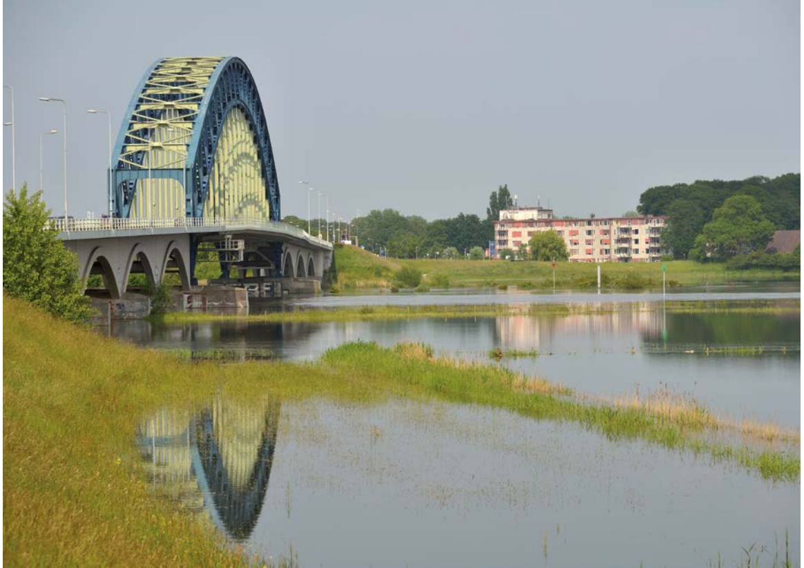
Zwolle, IJssel bij hoog water, IJsselbrug (1930)

Bijlage 1 Voorbeeld offerteaanvraag gebiedsbiografie