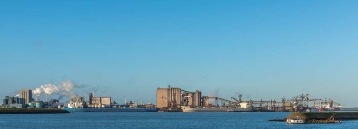
Rotterdam, Europoort, Noordzeeweg bij Rozenburg (wederopbouwperiode)

Een gebiedsbiografie belicht in woord en beeld hoe een gebied in de loop van de tijd veranderde onder invloed van de wisselwerking tussen mens en natuur, en hoe het verleden in het hedendaagse landschap doorwerkt.