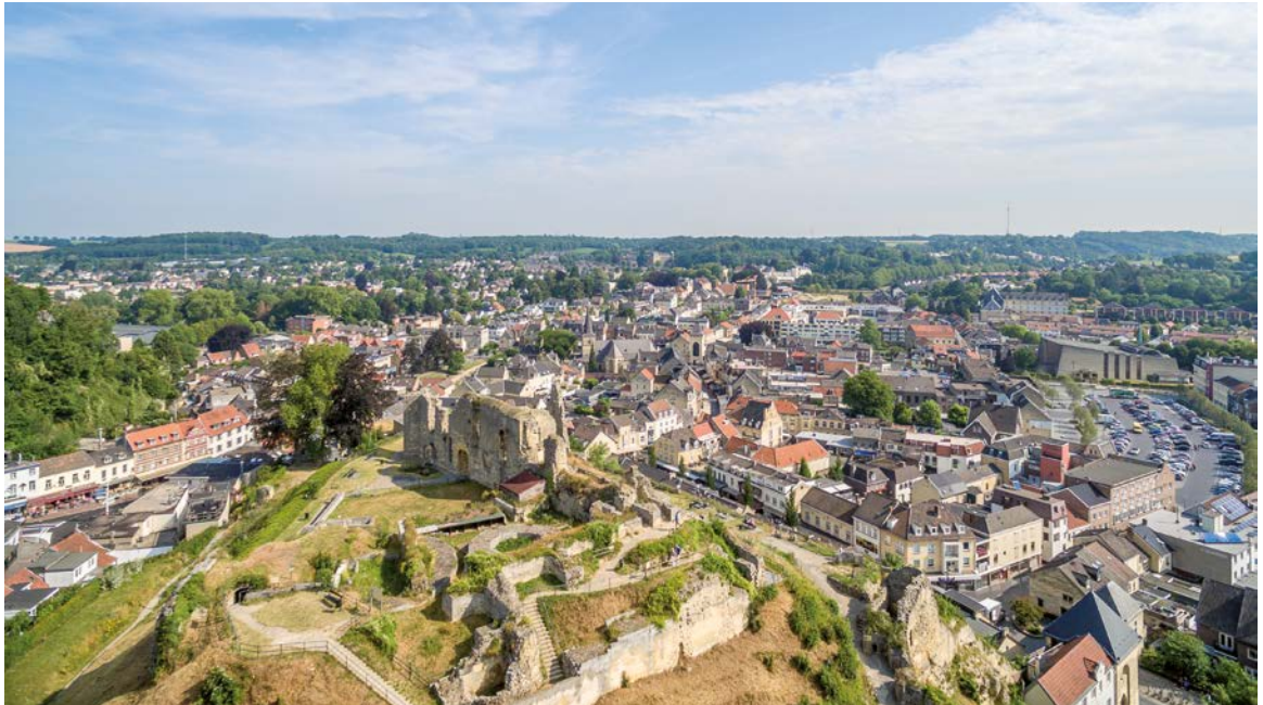
Valkenburg, Zuid-Limburg, kasteelruïne Valkenburg (gebouwd rond 1100 N.Chr.)

De komst van de Omgevingswet en de bijbehorende De Nationale Omgevingsvisie (NOVI) stelt overheden voor de opgave om hun omgevingsbeleid meer integraal en gebiedsgericht te maken. Oftewel: de verschillende sectorale belangen in een gebied moeten in samenhang worden afgewogen. Visie- en planvorming zijn op alle overheidsniveaus de belangrijkste stap om tot samenhangend beleid te komen. Een gebiedsbiografie kan waardevolle inhoudelijke input leveren voor deze visievorming, richting geven aan de uitvoering van plannen én een goed hulpmiddel zijn voor het (verplichte) participatieproces.